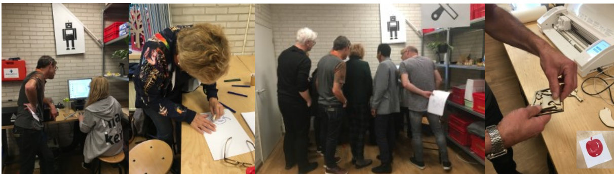
Digitale Fabricage: wegwijst met de lasercutter.

Na de workshoprondes was het borreltijd in het Café, en konden de deelnemers onder het genot van een hapje en drankje napraten en netwerken. De sfeer onder de aanwezigen maakte duidelijk dat het voor de meesten een inspirerende bijeenkomst was geweest. De organisatoren kijken dan ook terug op een succesvol evenement.